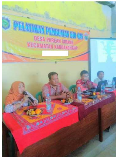
Gambar 2. Kegiatan Sesi Pertama

“Cara pembuatan Biogas dari Tanaman Eceng Gondok”. Foto kegiatan sesi pertama yaitu sebagai berikut.