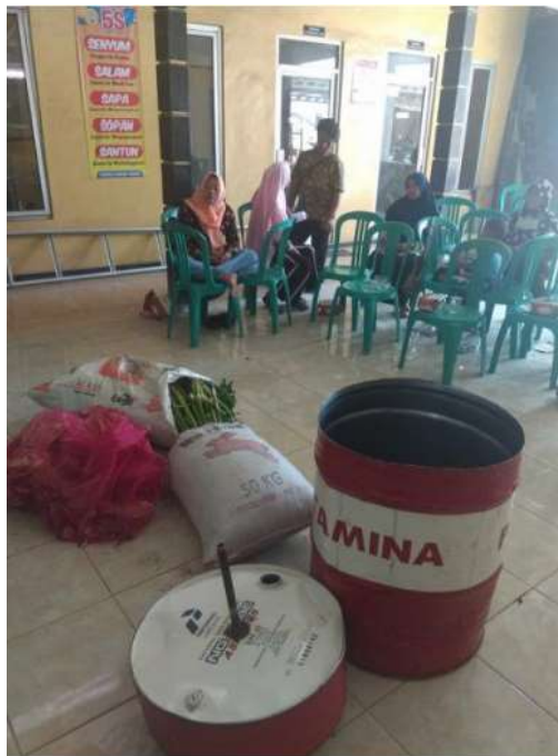
Gambar 4. Sesi Ketiga Pelatihan Pembuatan Eceng Gondok.

Adapun salah satu dokumentasi pada sesi ketiga terdapat pada gambar 4 berikut.