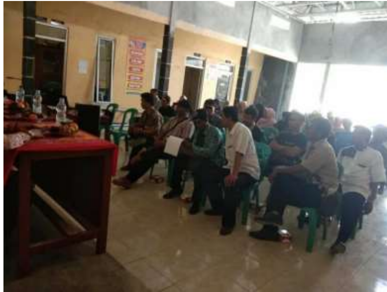
Gambar 3. Sesi Kedua

dan tidak akan meledak seperti halnya gas elpiji biasa. Menurut Dewi (2018) biogas merupakan salah satu sumber energi alternatif pengganti elpiji, dan dapat menjadi solusi sumber bahan bakar dalam mengatasi biaya ekonomi rumah tangga di perdesaan (Elizabeth & Rusdiana, 2011). Kegiatan penyuluhan pada sesi 2 yaitu sebagai berikut.