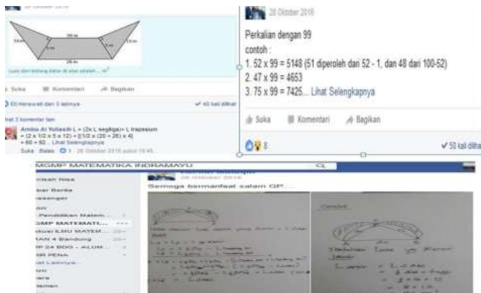
Gambar 7. Pemanfaatan Facebook dalam grup MGMP Matematika SMP

Guru-guru matematika yang ada dalam MGMP tersebut sebagian besar masih berpendidikan S1 dan berusia relatif muda yang merupakan usia produktif, yaitu masih memiliki potensi untuk mengikuti perkembangan Teknologi Informasi. Selain itu Guru-guru tersebut memiliki Notebook atau Laptop yang telah menggunakan Modem untuk melakukan koneksi internet. Namun, pemanfaatan IT dalam pembelajaran matematika masih kurang dilakukan. Teknologi belum dimanfaatkan sebagai media eksplorasi dalam pembelajaran Matematika untuk mengembangkan kemampuan berpikir tingkat tinggi siswa guru. Guru matematika hanya memanfaatkan Infokus dalam penyajian materi melalui powerpoint yang dibuat guru. Infokus digunakan dalam presentasi sebagai pengganti papan tulis. Hal ini dikarenakan kurangnya pengetahuan siswa tentang software-software matematika. Sementara itu pihak sekolah tempat guru mengajar juga tidak memiliki petugas khusus yang menangani laboratorium komputer termasuk penggunaan software untuk pembelajaran. Pemanfaatan teknologi di luar kegiatan belajar mengajar di sekolah yang telah berjalan yaitu penggunaan facebook dalam grup MGMP Matematika. Melalui facebook para guru menyajikan pembahasan soal maupun pemberian informasi. Berkaitan dengan pemanfaatan facebook pada grup MGMP disajikan pada gambar berikut: