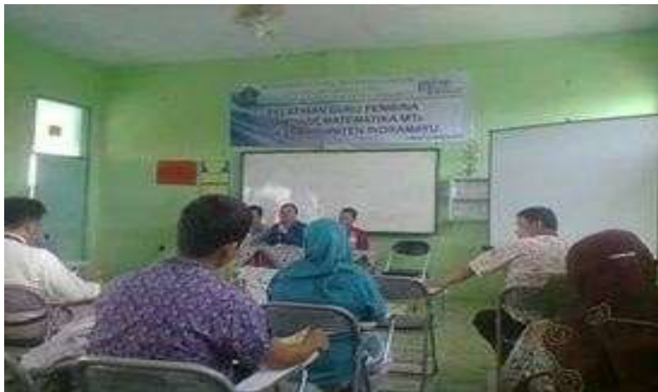
Gambar 5. Kegiatan Pelatihan di MGMP MTs