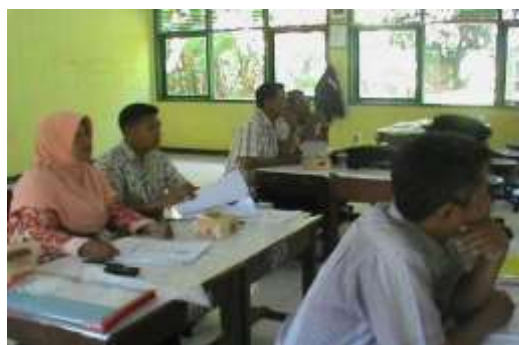
Gambar 3. Kegiatan Bedah Soal Post Test GP-TM MGMP Matematika SMP