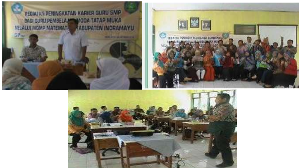
Gambar 2. Kegiatan Tatap Muka (TM) Guru Pembelajar (GP) MGMP Matematika SMP

Beberapa kegiatan yang dilakukan diantaranya bedah soal UN dan persiapan untuk uji kompetensi guru (UKG), dan persiapan kegiatan OSN (Olimpiade Sains Nasional), mengadakan tatap muka (TM) guru pembelajar (GP) yaitu guru yang mempunyai nilai UKG rendah ( < 55 ), melakukan bedah soal post test GP-TM MGMP Matematika, dan melakukan posttest. Sementara itu, kegiatan yang berkaitan dengan pemanfaatan teknologi khususnya software dalam pembelajaran matematika belum secara khusus dilakukan. Beberapa kegiatan MGMP disajikan pada gambar berikut: