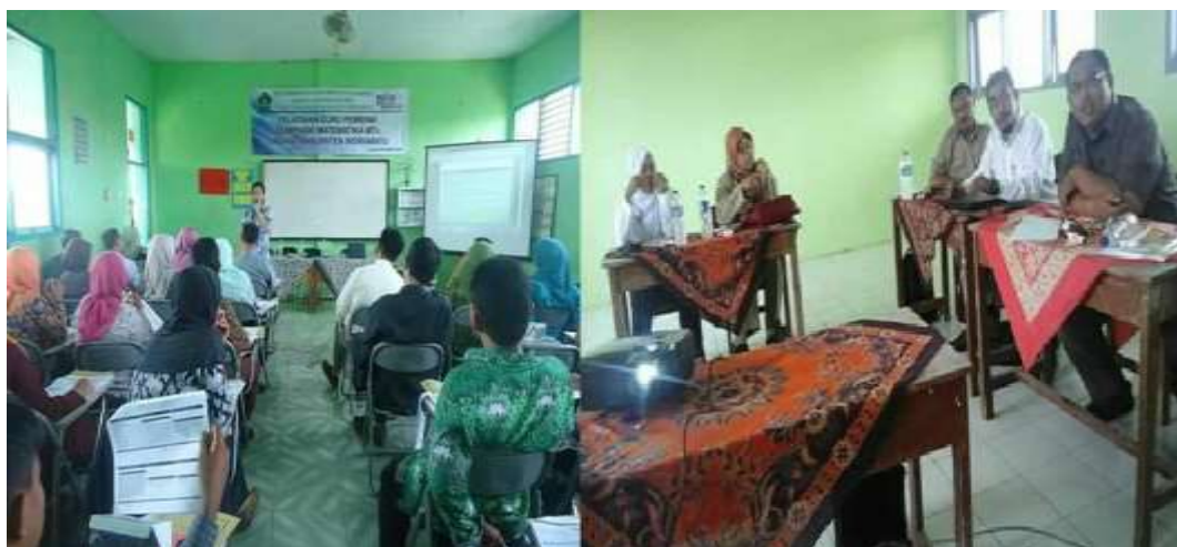
Gambar 6. Pelatihan Guru di MGMP MTs dan Diskusi Kelompok