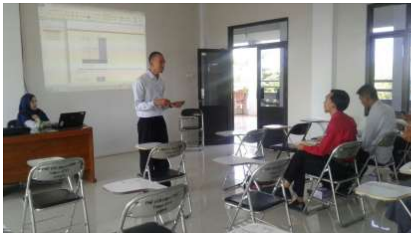
Gb. 9. Beberapa pemateri sedang memberikan instruksi pemakaian Geogebra

Gambar 8 memperlihatkan pemateri menjelaskan teori belajar secara umum, pentingnya media pembelajaran khususnya media GeoGebra . Selanjutnya praktek penggunaan GeoGebra langsung diberikan oleh pemateri/instruktur yang diikuti oleh para guru seperti disajikan pada Gambar 2 dan Gambar 3.