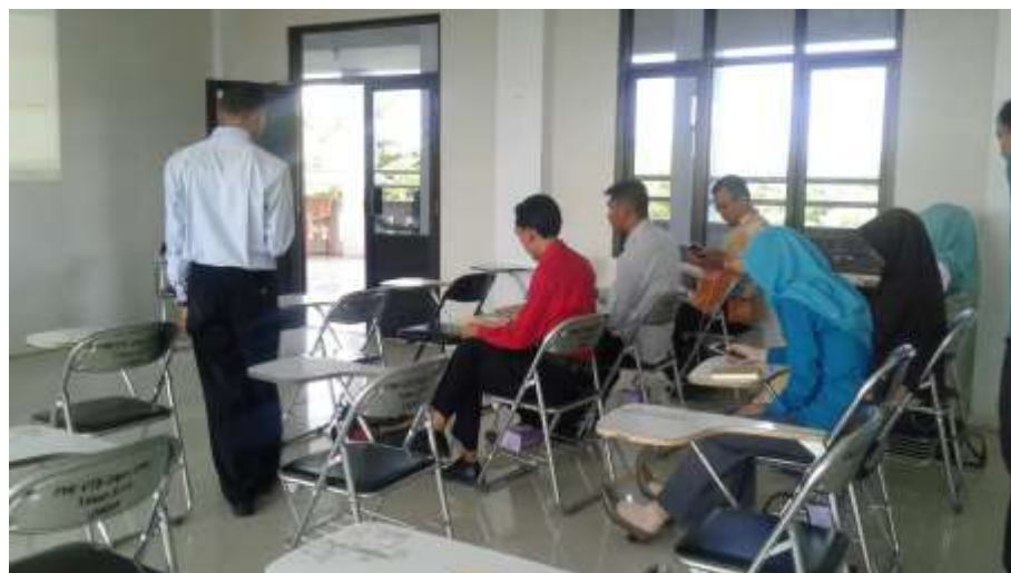
Gb. 10. Peserta mencoba Geogebra melalui HP Android dipandu oleh Pemateri

Gambar 9 memperlihatkan pemateri sedang mempraktekan penggunaan GeoGebra