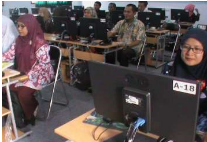
Gambar 4. Kegiatan Postest GP-TM MGMP Matematika SMP