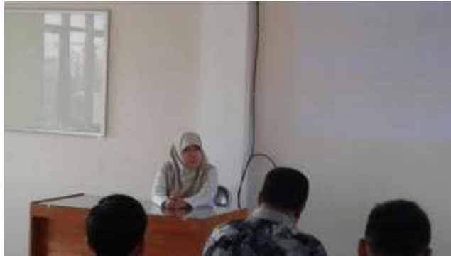
Gb 8. Pemberian materi awal

Gambar 8 memperlihatkan pemateri menjelaskan teori belajar secara umum, pentingnya media pembelajaran khususnya media GeoGebra . Selanjutnya praktek penggunaan GeoGebra langsung diberikan oleh pemateri/instruktur yang diikuti oleh para guru seperti disajikan pada Gambar 2 dan Gambar 3.